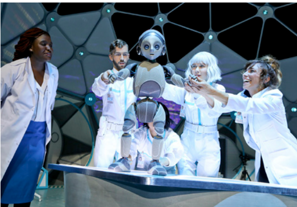
MOBY DICK vs A.H.A.B. | All Heroes Are Bastards Kooperation Retrofuturisten mit Schauspiel Dortmund, 2015

„[...] Ein seltsamer Traum. Ästhetisch ist das ein Augenschmaus. Und als Fazit dieses immer auch politischen Abends bleibt stehen: Für komplexe Dinge gibt es keine einfachen Lösungen.“ (Deutschlandfunk, 30. März 2015)