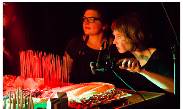
7 SONGS TO SURVIVE // TOBS Solothurn/Biel (CH), 2020/21